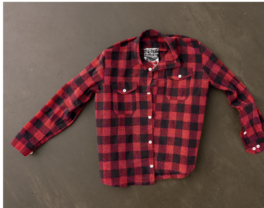
UNCLE (2022), PAR NICO WILLIAMS