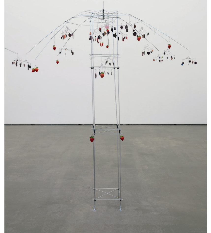
SITE PARASITE DICE PARADISE (DÉTAIL) (2023), DE GABRIELLE L'HIRONDELLE HILL

est une artiste métisse de Colombie-Britannique. On peut souvent sentir ses œuvres avant de les voir en raison des ingrédients naturels, tels que le tabac, les baies et la graisse alimentaire Crisco qu'elle utilise. Gabrielle L'Hirondelle Hill rembourre des collants de tabac pour créer de petits lapins ou de plus grands bipèdes à l'apparence humaine ayant des caractéristiques animales, le tout agrémenté d'objets trouvés, comme des languettes de canettes d'aluminium ou des espadrilles usagées. Elle dessine également avec des pigments naturels sur du papier badigeonné de Crisco et ajoute sur ses toiles de petits objets qu'elle a dénichés dans son quartier. COOPERCOLEGALLERY.COM