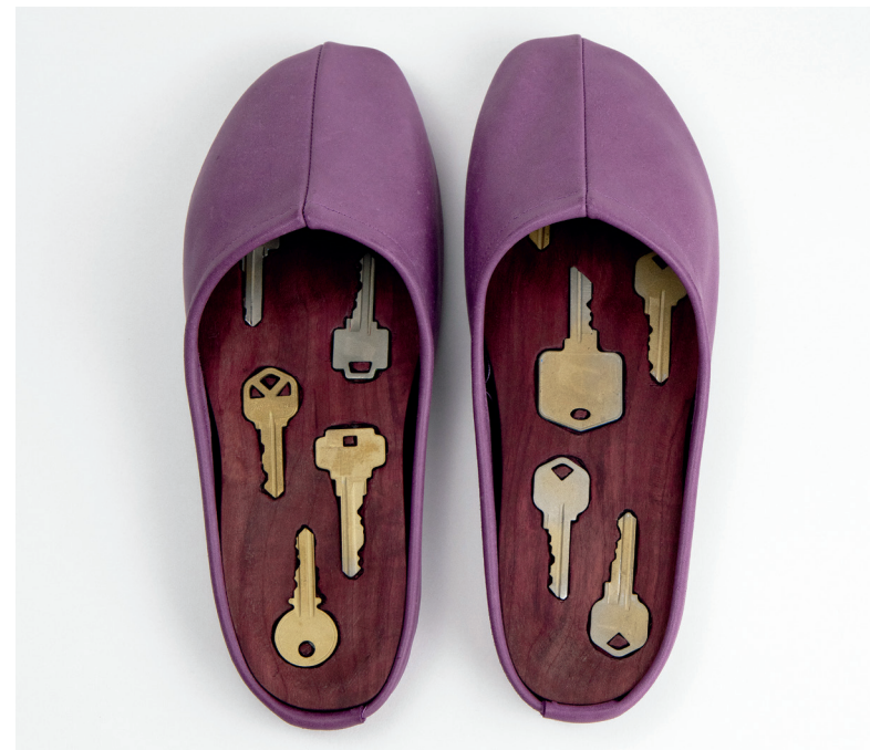
KEYCHAINS (2024), DE KYLE ALDEN MARTENS