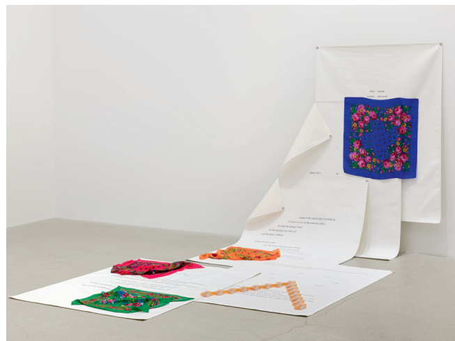
GO GO (2022), PAR TANYA LUKIN LINKLATER

TANYA LUKIN LINKLATER est une artiste multidisciplinaire dont les racines sont ancrées dans la performance, la chorégraphie et l'écriture. Elle crée des installations dans des musées et des galeries en utilisant la sculpture et la vidéo, notamment. Elle est originaire d'Alutiq/Sugpiaq, dans le sud-ouest de l'Alaska — où de nombreux membres de sa famille vivent encore —, et demeure actuellement à North Bay, en Ontario. Elle a exposé et joué dans le monde entier, notamment à la Documenta 14, à Cassel, en Allemagne. Pour créer, elle s'inspire de sa lignée familiale, des pratiques artistiques autochtones et de l'influence de l'environnement sur notre manière de vivre et de penser. CATRIONAJEFFRIES.COM