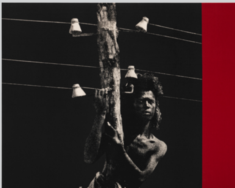
Between departures, returns and excesses of image, Part V , 2021, sérigraphie sur toile / serigraph on canvas, 89 × 112 cm

Lacunes, trous, fissures et frictions : voilà le périmètre de l'exposition de Dawit L. Petros présentée dans le cadre du programme satellite de Momena 2021. Par ce parcours, composé de photographies et de sérigraphies sur papier et sur toile, l'artiste érythréen établi à Montréal et à Chicago poursuit sa réflexion sur l'héritage de l'histoire coloniale déjà abordée avec Spazio disponibile , installation vue en 2021 aux University Buffalo Art Galleries, et sur les phénomènes d'immigration et d'émigration passés et présents. Pour ce faire, Dawit L. Petros crée un itinéraire visuel qui entrecroise différentes temporalités historiques et une pluralité d'espaces géographiques entre l'Afrique, l'Europe et l'Amérique du Nord. À ces éléments s'ajoute aussi un volet plus abstrait concernant le rôle que le progrès technologique a joué dans les déplacements, mais aussi dans l'affirmation du regard sur l'autre.