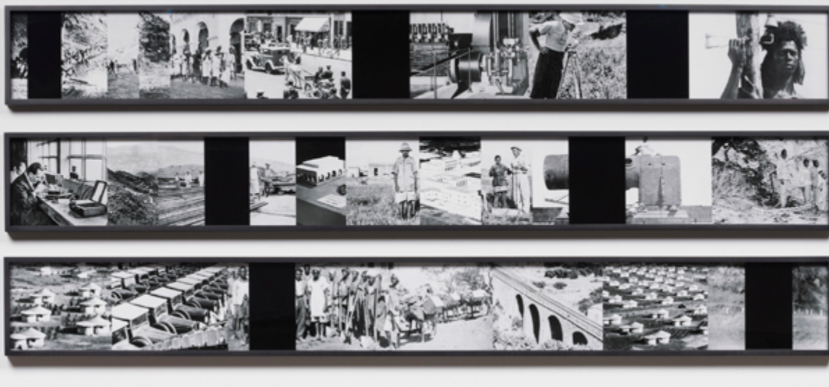
A Constant Re-telling of the Future in the Past (Part I) , 2020, impression au jet d'encre / archival pigment print, 81 × 183 cm

Le troisième volet de l'exposition consiste en une référence abstraite et formelle au progrès technologique souvent évoqué par la rhétorique coloniale, mais aussi à la participation de l'Italie à l'Exposition universelle de Chicago, en 1933. Construit sous forme d'avion, le pavillon italien affichait le symbole des faisceaux des lecteurs, s'inspirait du style rationaliste et visait à célébrer le lien entre tradition et modernité. L'artiste évoque cet événement et ses références visuelles et symboliques avec la série de sérigraphies sur papier Istruzioni (Transit, Trajectoires, Invisibles Networks) , qui représentent, entre autres, une carte aérienne et le dessin d'une pièce d'avion. La référence à l'esthétique moderniste et à la rhétorique visuelle des symboles fascistes clairement évoquée par Dawit L. Petros constitue la voie privilégiée pour un travail sur les documents d'archives. Gaps, holes, fissures, and frictions est une exposition saisissante, dont la simplicité formelle est porteuse d'une grande richesse esthétique et une réflexion dense sur les liens entre passé et présent et les trajectoires qui les constituent.