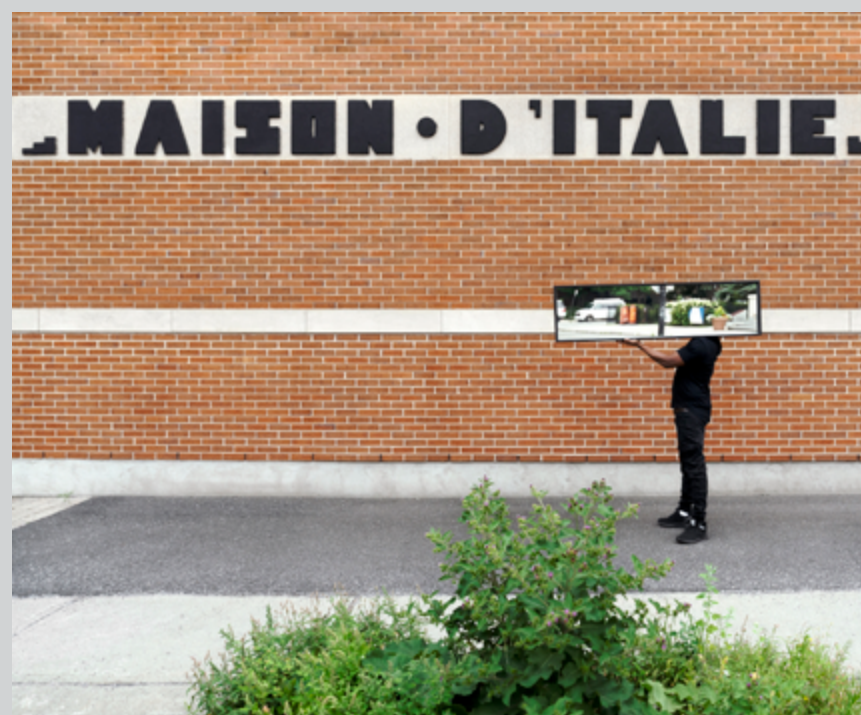
Untitled (Epilogue VII), Montreal, Quebec, 2021, impression au jet d'encre / archival pigment print, 76 × 95 cm