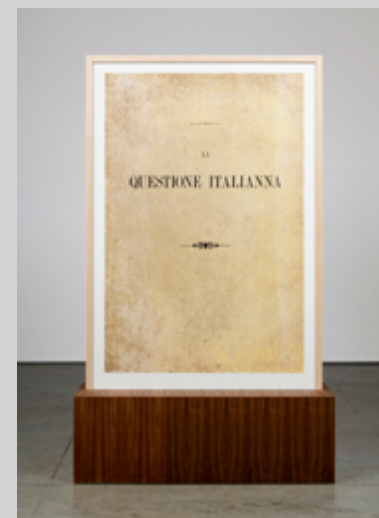
La questione Italianna / La questione Africana, 2020, sérigraphie, papier Coventry Rag, plexiglas, pin, noyer, piédestal / serigraphy, Coventry Rag paper, plexiglass, pine, walnut, plinth, 76 × 56 cm chacune / each

The third part of the exhibition consists of an abstract and formal reference to the technological progress often evoked by colonial rhetoric, as well as to Italy’s participation in the Chicago World Fair in 1933. Built in the form of an airplane, the Italian pavilion, displaying the symbol of the victors, was inspired by rationalist style and aimed to celebrate the connection between tradition and modernity. Petros evokes this event and its visual and symbolic echoes with the series of serigraphs on paper Istruzioni (Transit, Trajectoires, Invisibles Networks) , which show, among other things, an aerial map and the design of an airplane part. Petros’s clearly drawn reference to the modernist